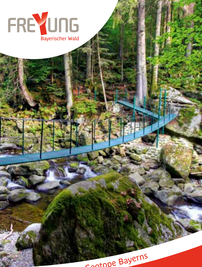
Eines der schönsten Geotope Bayerns